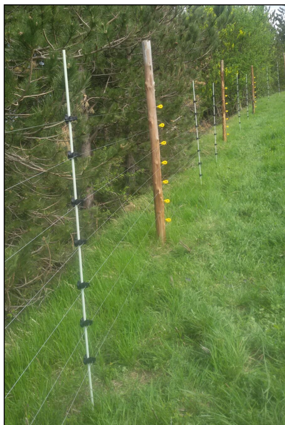
Immagine 2 - Recinzione immagine