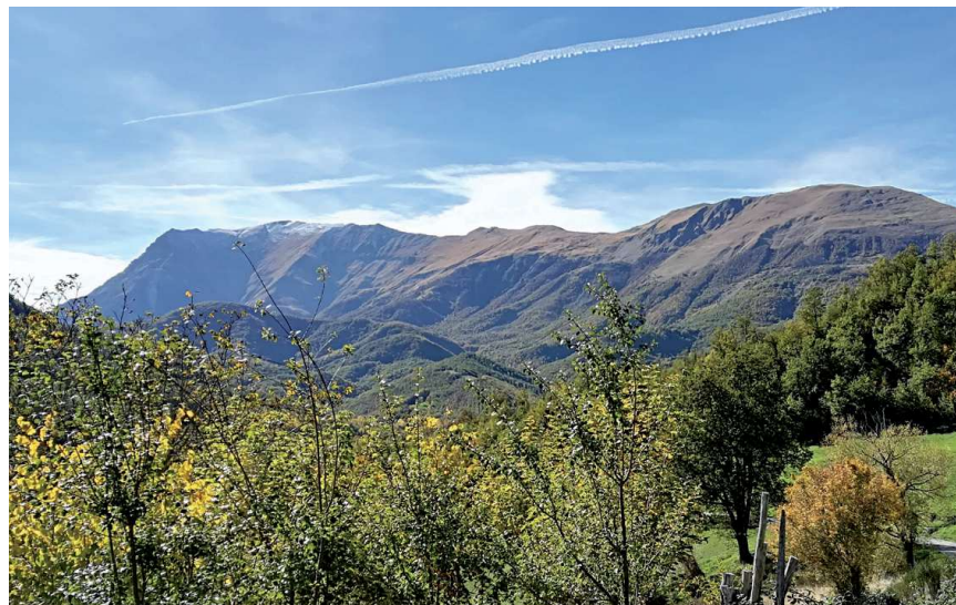
In sight of Monte Vettore and the sharp crest of Monte Torrone - Montemonaco

The path starts from the town of Montemonaco, perched at the altitude of 1000 meters above sea level, a real balcony overlooking the Sibillini Mountains and the Piceno hills all the way across to the Adriatic Sea. In addition to the presence of exceptional natural and historical highlights, the importance of this area is also linked to many evocative legends, such as those that still cloak Lago di Pilato (Pontius Pilate’s Lake) and Monte Sibilla with charm and mystery. From the base of Monte Sibilla, the route descends into the Aso valley and then climbs up to the town of Altino, another pleasant vantage point. It then winds through the hamlets of Vallegrascia and Rascio, at the foot of the long ridge that climbs up to Monte Vettore (2476 m), the highest mountain in the Sibillini. At the foot of Monte Torrone, at 1159 m altitude, there is the ancient church of Santa Maria in Pantano, dating back to the end of the 8 th century, whose original name “Santa Maria delle Sibille” testifies to the ancient and frequent custom of combining Christian rites with pagan ones.