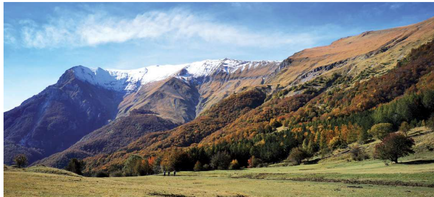
Monte Vettore as seen from the meadows of Monte Oialona - Montegallo

The fauna of the territory is characterised by interesting species such as roe deer, wolves and wild cats, as well as numerous species of birds typical of wooded environments such as the red woodpecker, the sparrow hawk and the rare goshawk, in Italian “astore”, from which the name of the hamlet Astorara seems to derive.