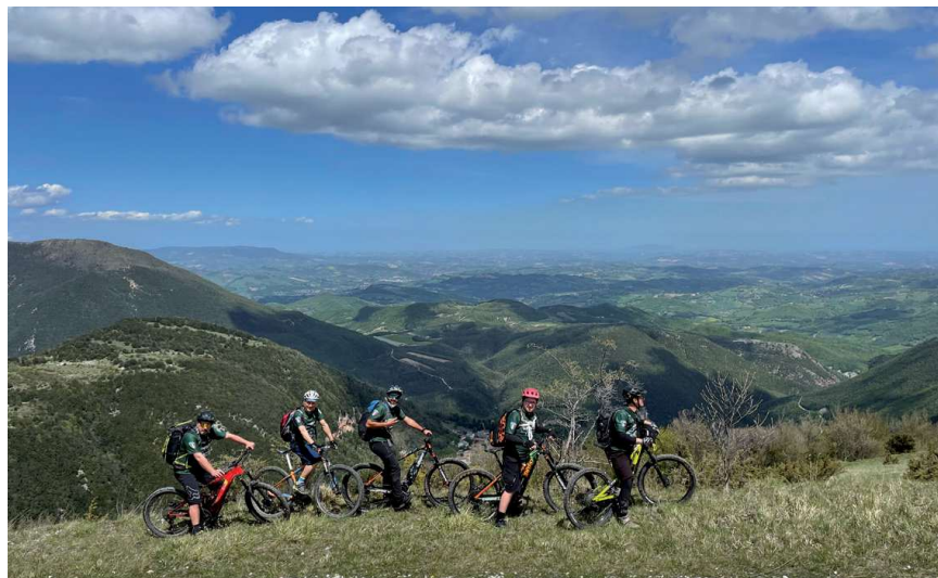
On the balcony of Monte Frascare, overlooking the Marche hills - Cessapalombo and San Ginesio

The path starts from the Sanctuary of San Liberato, the construction of which was ordered in 1274 by the lords of Brunforte, and through mixed woods of hornbeam, ash and holm oak it reaches the village of Monastero (723 m), overlooking the deep and wild Fiastrone Valley. At the foot of Monastero there is the Abbey of San Salvatore, re-founded at the beginning of the 11 th century by the Benedictine San Romualdo. Monasticism was a widespread phenomenon throughout the Fiastrone Valley, as it was an ideal location for monastic life. In the final stretch of the route, the ruins of the Castle of Col di Pietra are still visible jutting out from a spur of rock. The castle was the last Varano fortress that belonged to Camerino as of the second half of the 13 th century. The narrow valley then suddenly opens onto Pian di Pieca, a sweeping alluvial plateau, while from the hamlet of Rocca Colonnalta the view extends over the fertile and harmonious hills of San Ginesio.