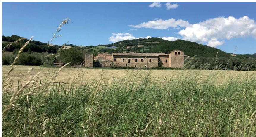
The Castle of Beldiletto situated in the Chienti plains - Valforance

The starting point is the town of Pievebovigliana (441 m), the municipal capital of Valforance, which boasts some interesting historical and architectural remains, including the medieval church of Santa Maria Assunta with its Romanesque crypt, and the “Raffaele Campelli” museum, in which there are Roman and pre-Roman finds from the surrounding area. Going up towards the panoramic hamlets of Isola, Colle San Benedetto and Roccamaiia one crosses the wooded high hills and chestnut groves that cover the northern slope of Monte San Savino (892 m). At the foot of Monte Fiegini (1324 m) is the church of San Giusto, considered to be one of the most important Romanesque monuments in the Marche. Going back down the Chienti river one encounters Polverina lake, built in 1967 for the production of hydroelectric energy, which offers humid environments suitable for the nesting and wintering of numerous water birds. Near the lake there is also the Castle of Beldiletto, built in the 14 th century by Giovanni Da Varano for the strategic purpose of controlling an important communication route and subsequently adapted into a Renaissance villa by Giulio Cesare Da Varano.