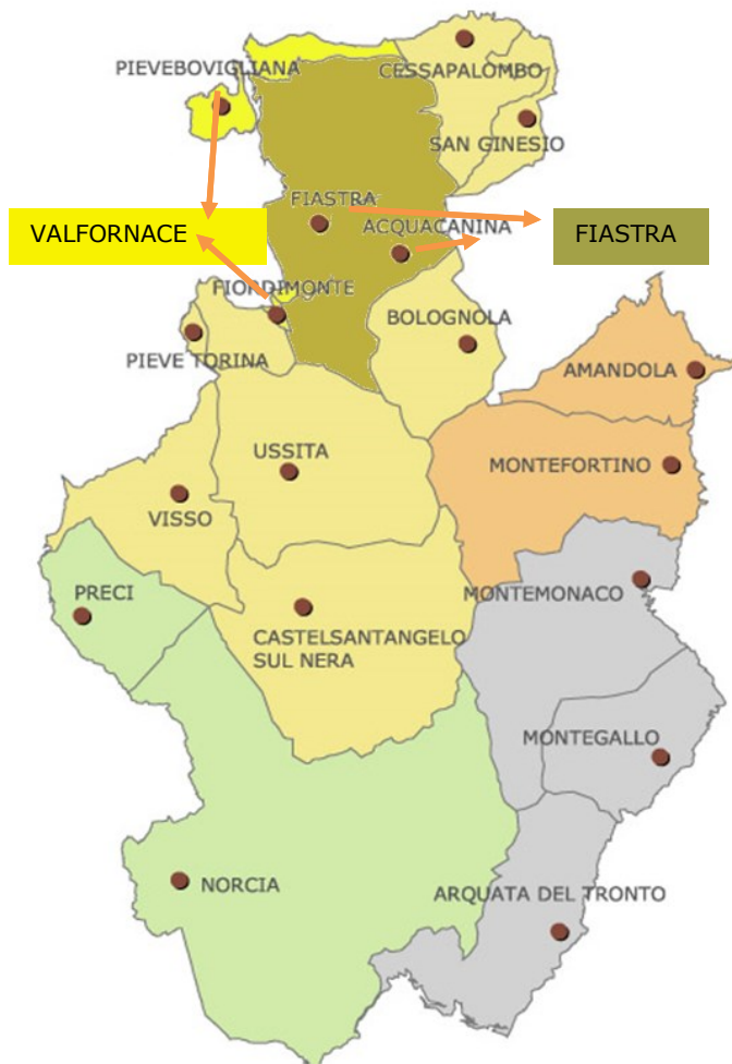
Fig. 1 Carta dei Comuni del Parco

Di seguito la Carta del Parco nazionale dei Monti Sibillini con la ripartizione amministrativa dei Comuni e delle Province. In rosso la Provincia di Fermo, in blu quella di Ascoli, in giallo quella di Macerata e in verde quella di Perugia.