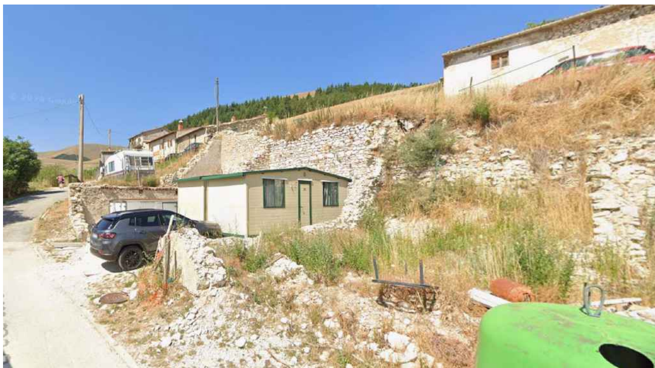
punto di vista 9_ POST SISMA