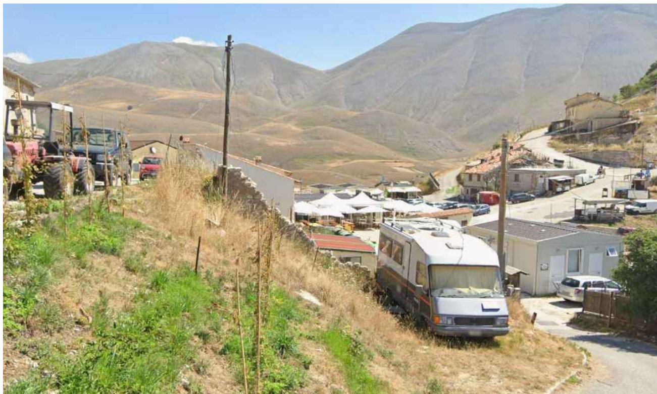
punto di vista 8_ POST SISMA