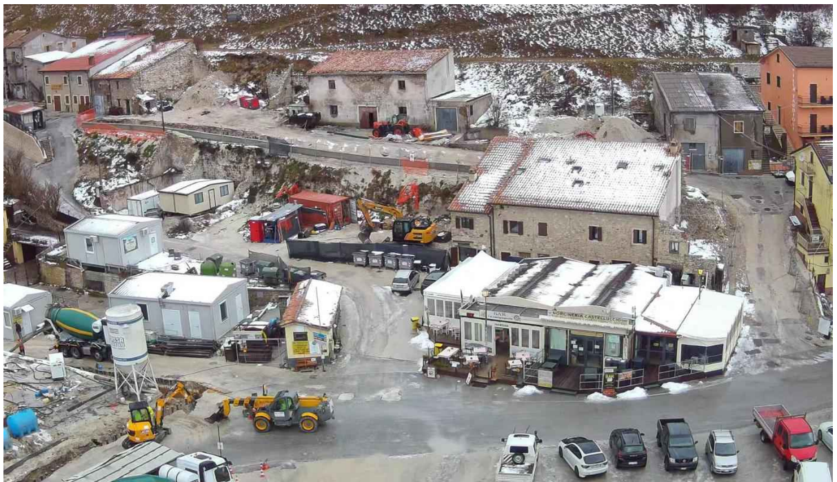
punto di vista 5_ POST SISMA