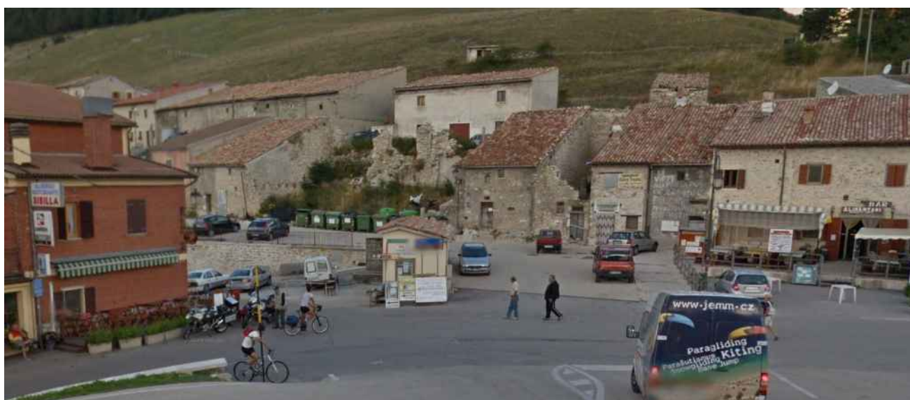
Punto di scatto 1)_ PROSPETTO PRINCIPALE ANTE SISMA