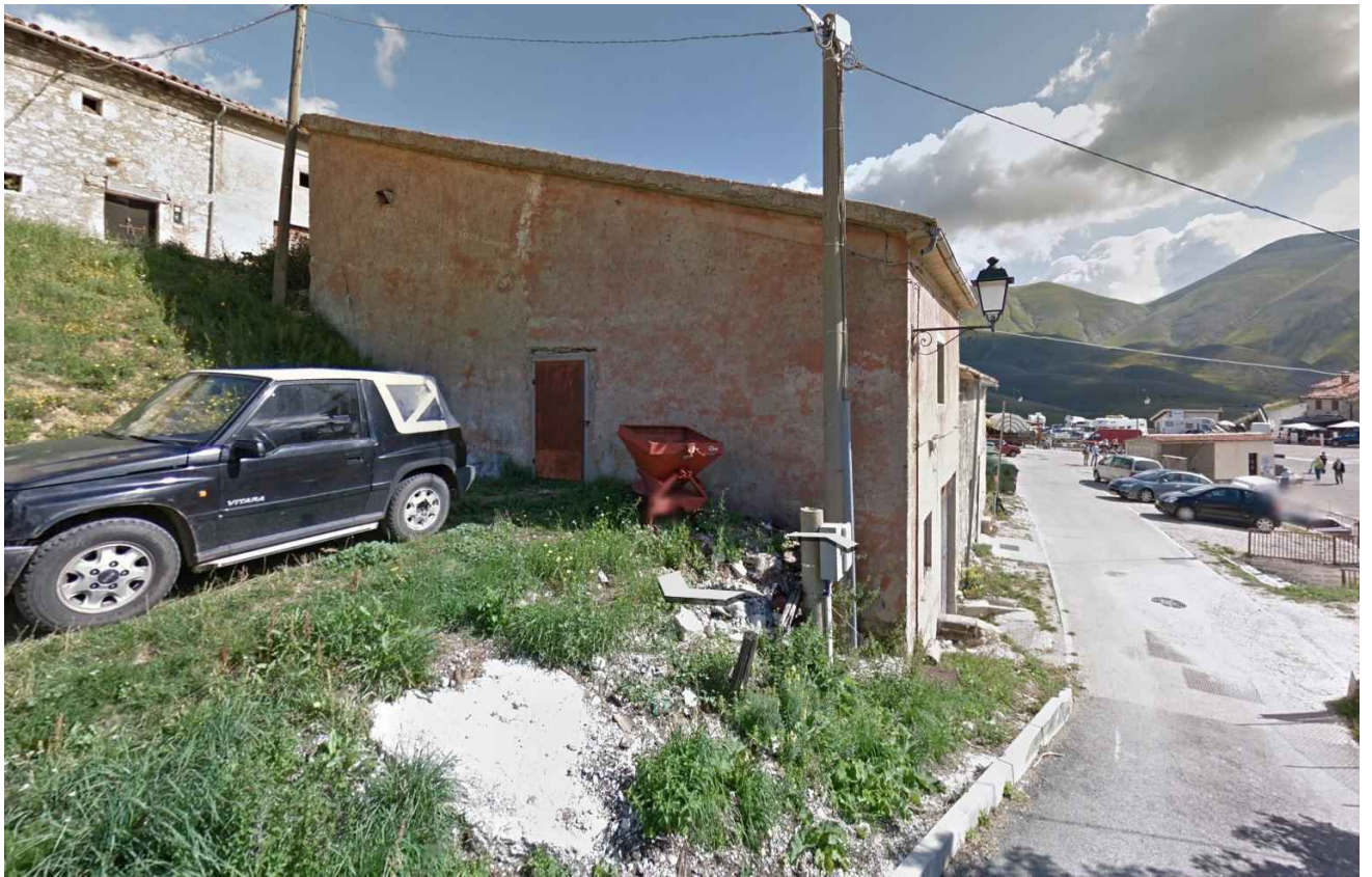
punto di vista 2_ Prospetto laterale ANTE SISMA