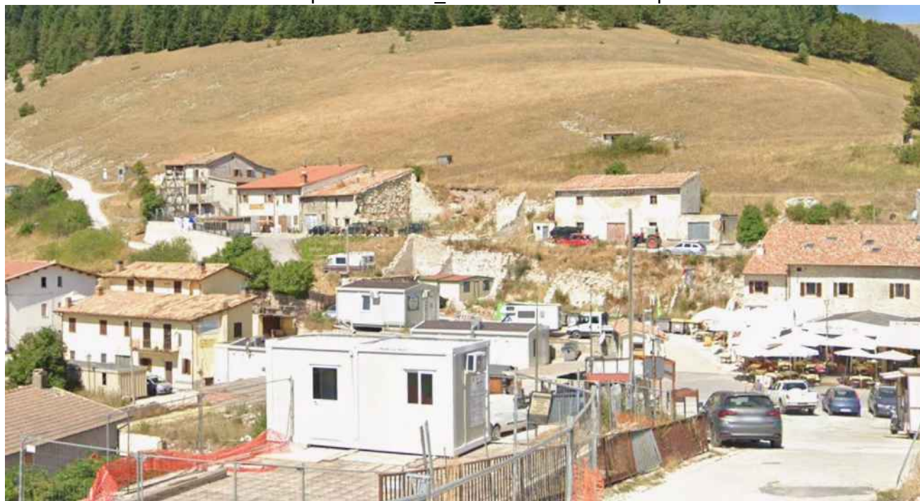
Foto d'inquadramento _ scatto da Via degli sciatori