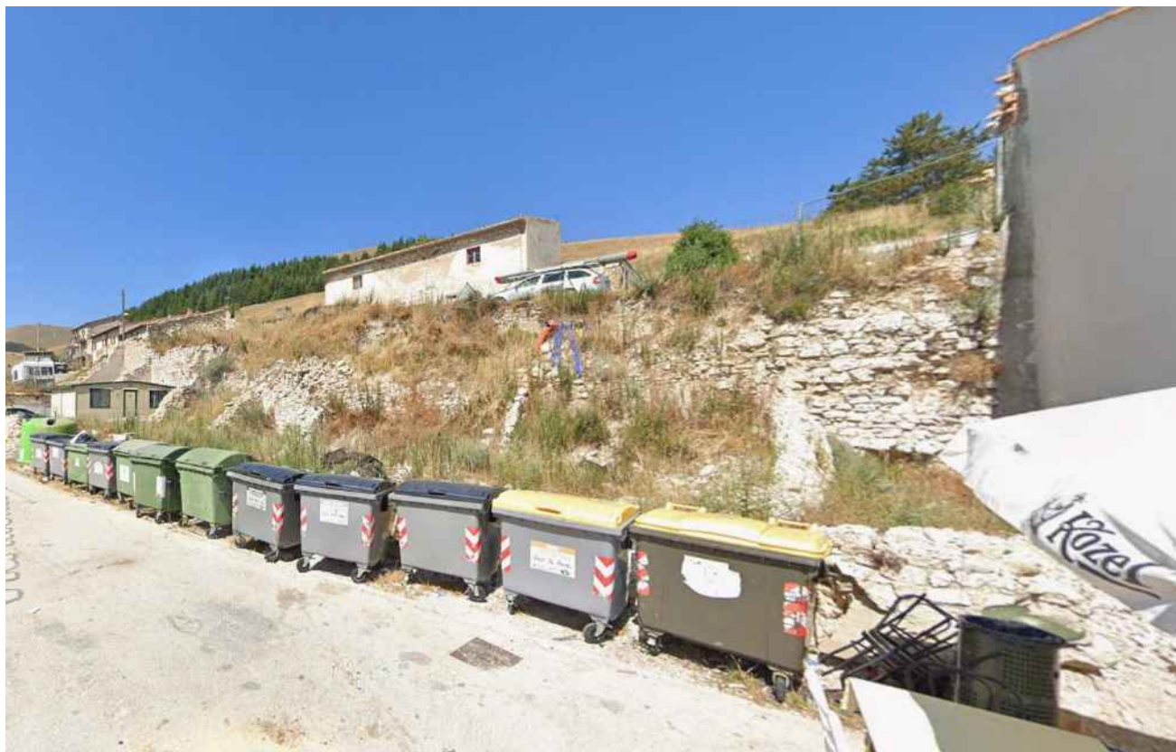
punto di vista10_ POST SISMA