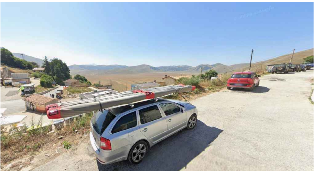
punto di vista 7_ POST SISMA