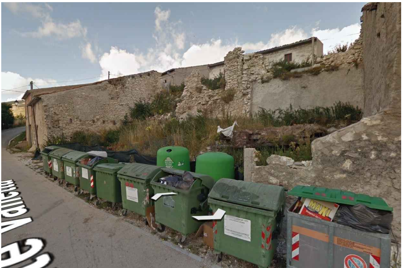
punto di vista 3_ ANTE SISMA