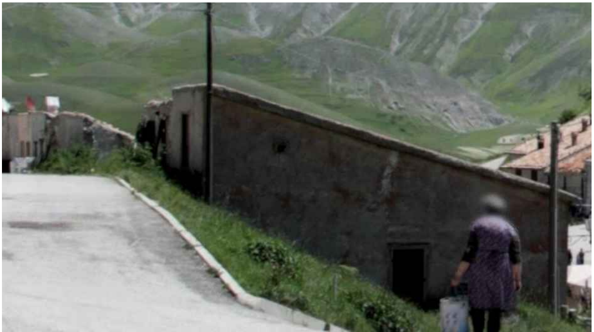
punto di vista 4_ ANTE SISMA